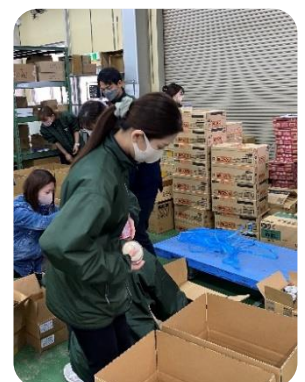
< フードバンクつばめの協力で配送 >

奨学金の応募した人数は、420人。そのうち、フードバンクへの支援要請があったのは120世帯です。その多くは、宅配で配布することにいたしました。